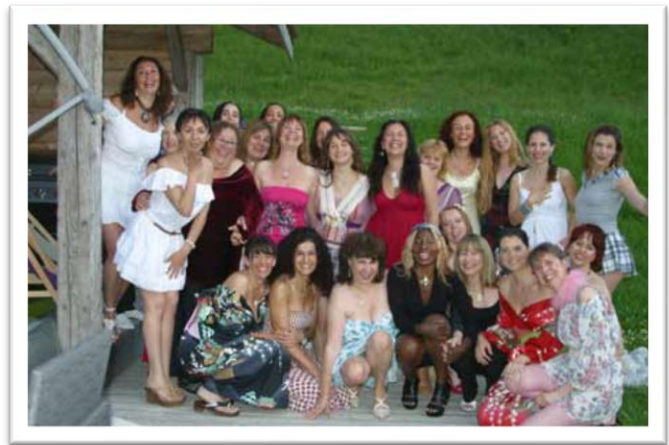
Las Ángeles de Europa alistándose para recibir pronto a Maitreya

Cuando te pones en este estado mental, pensando "Nunca, nunca doy suficiente amor", entonces estás enamorado. RAEL, junio del 65 dH