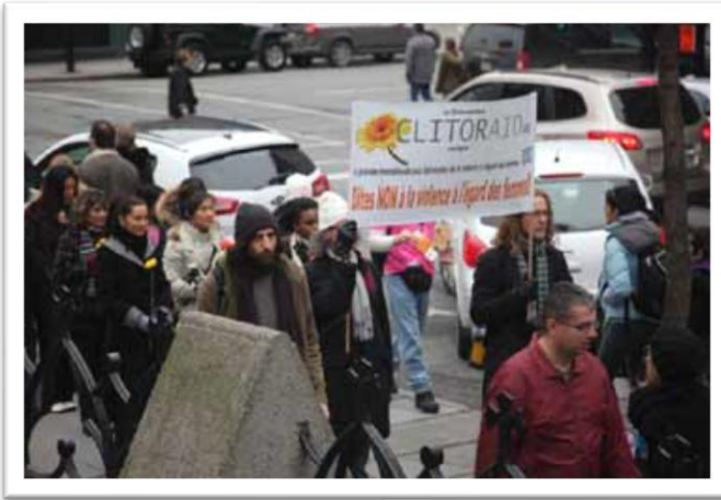
Montreal, Clitoraid en las calles :-)