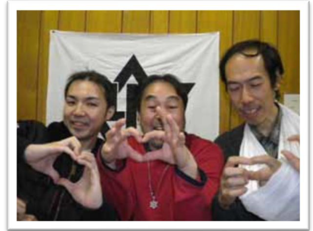
Amor desde Hokkaido, Japón.