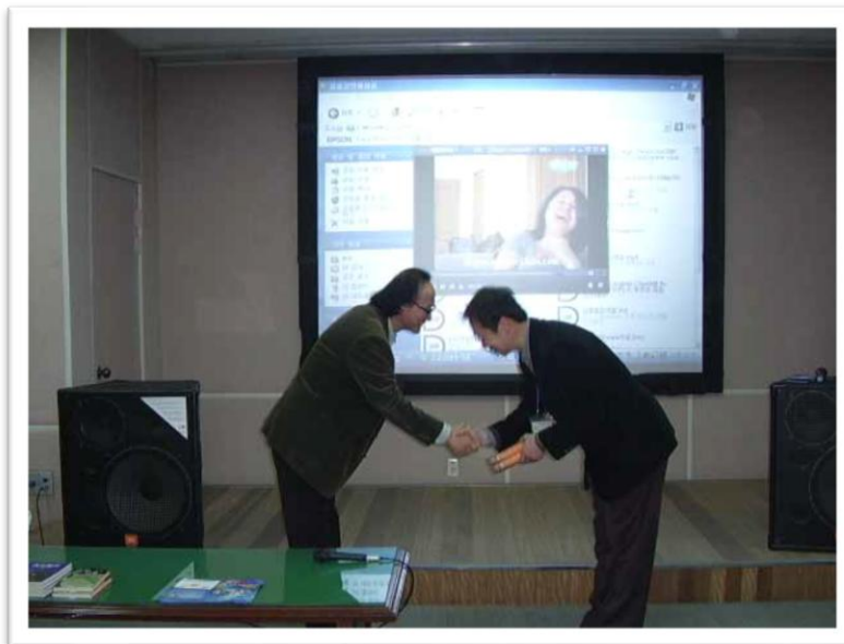
Difusión en una escuela secundaria en Corea del Sur.