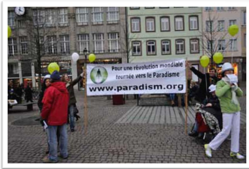
Estrasburgo, Francia, difusión del Paraíso.