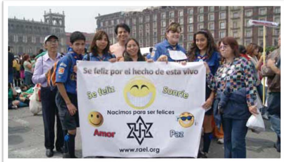
Ciudad de México... difusión sobre la felicidad