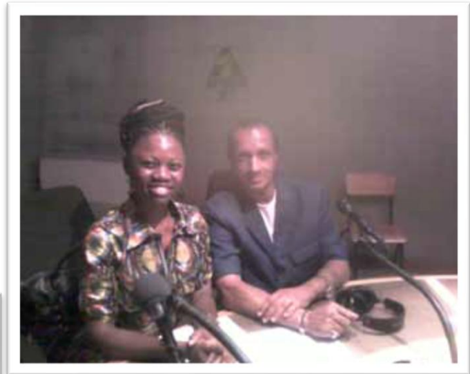
Libreville, Gabón, Lamour en una entrevista radial.