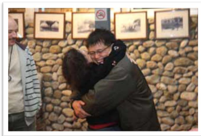
Academia de la Felicidad en Taiwán.