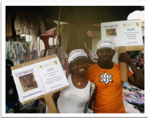
Libreville, Gabón, acción de rechazo a la mutilación genital femenina, 4 de febrero