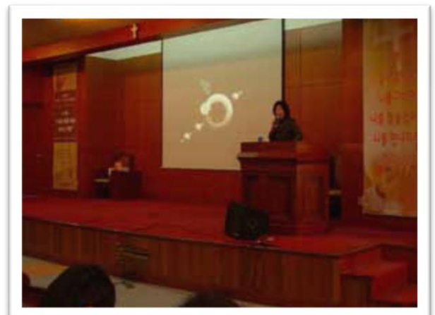
Conferencia en Anansi, Corea del Sur.