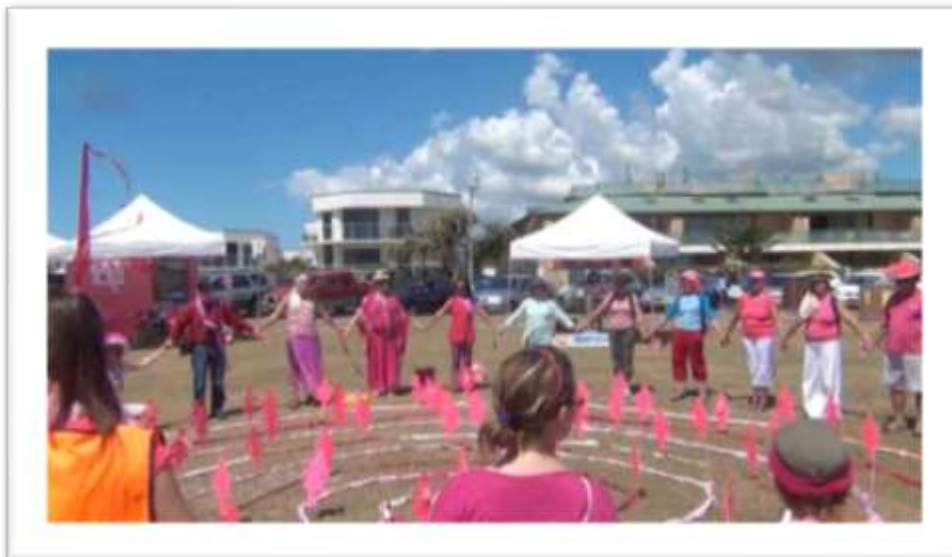
Bahía de Byron, Australia