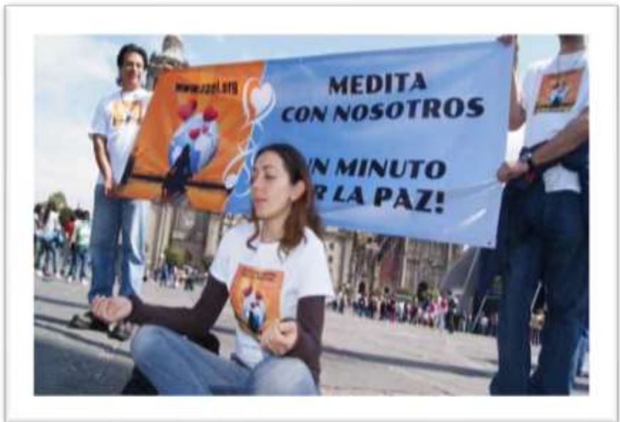
Campana Un minuto por la paz en México

¿Qué es ser inteligente? Es estar conectado, "intelligere" en latín significa estar conectado. Cuando piensas, estás desconectado. Cuando sientes, cuando eres, estás conectado con todo, con el infinito. Y es por eso que no pensar no es lo opuesto a la ciencia. RAEL, septiembre 67 dH