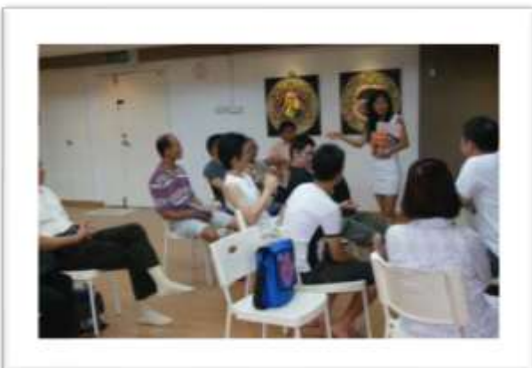
Malasia, 7 de octubre 1