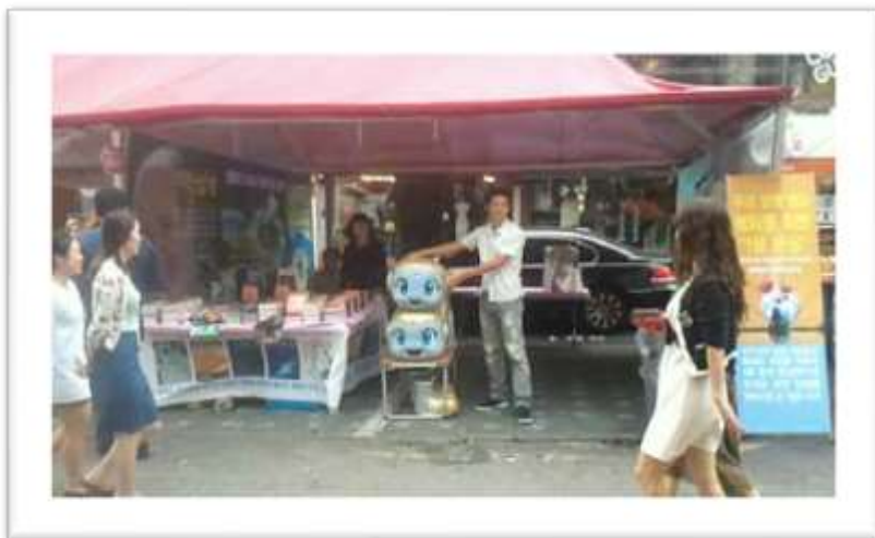
Festival del Libro en Seúl, Corea