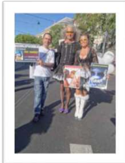
Difusión de Aramis en Viena, Austria