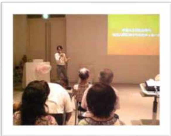
Conferencia en Kansai, Japón