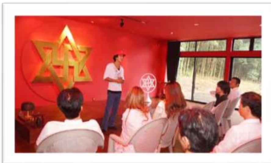
Encuentro en el Korindo en Tako, Japón