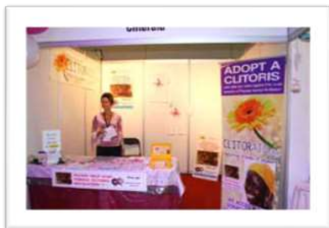
Clitoraid en una sexpo en Brisbane, Australia