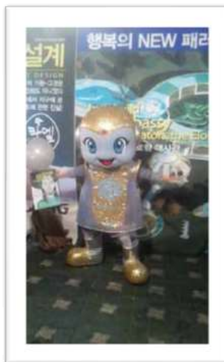
Seúl, Corea 1