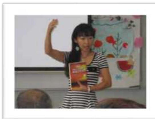
Conferencia en Kyushu, Japón