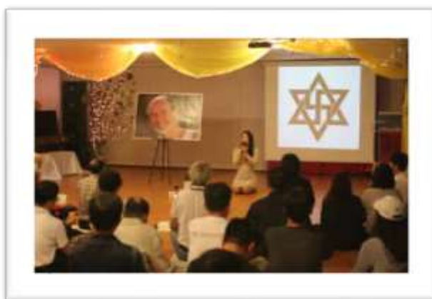
Reunión en Seúl, Corea