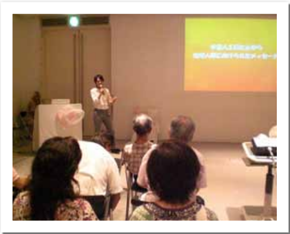
Conference a Kansai, Japon