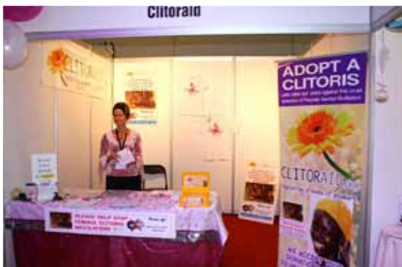
Clitoraid a sexpo a Brisbane, Australie