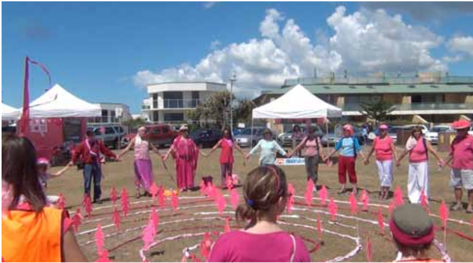
Byron Bay, Australie