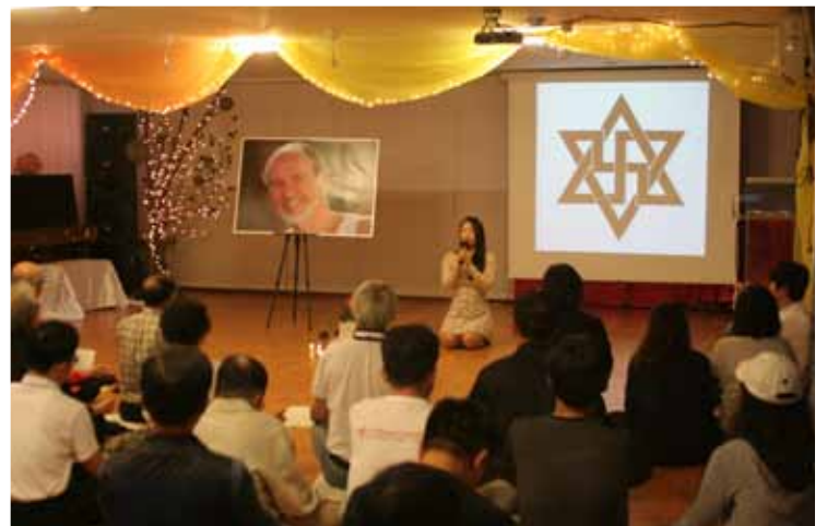
meeting a Seoul, Coree