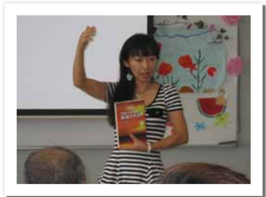
Conference a Kyushu, Japon