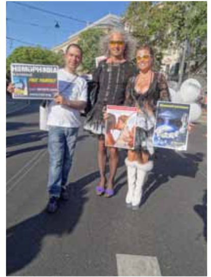
Aramis diffusion a Vienne, Autriche