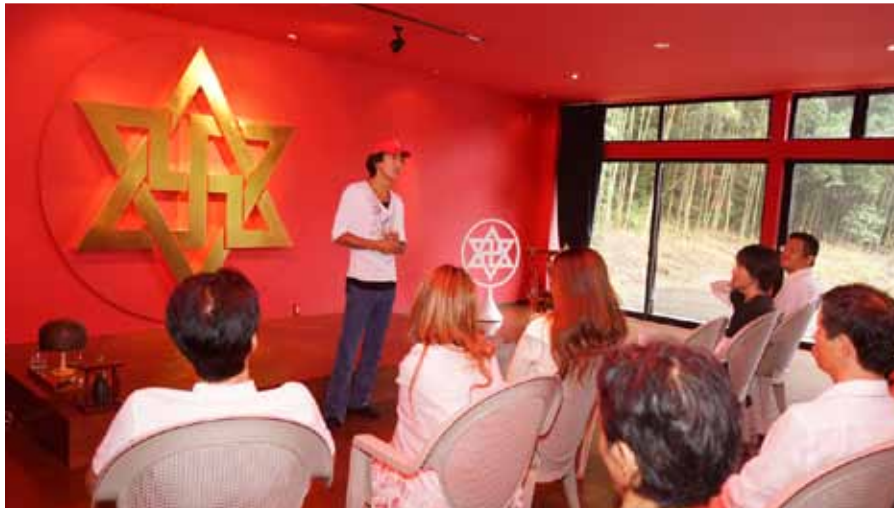
Meeting au Korindo aTako, Japon