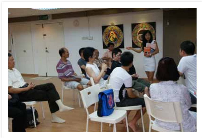
Malaysia, 7 Octobre