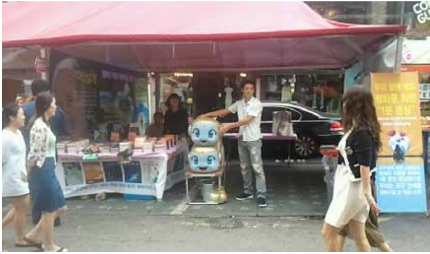
festival du livre a Seoul, Coree