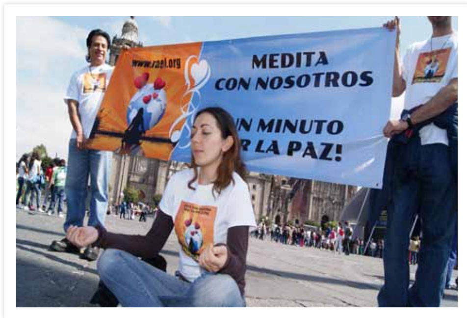
Campagne une minute pour la paix au Mexique