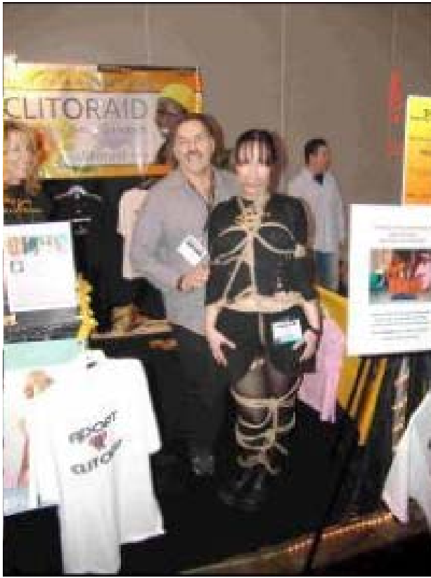
Momento de aventura.....