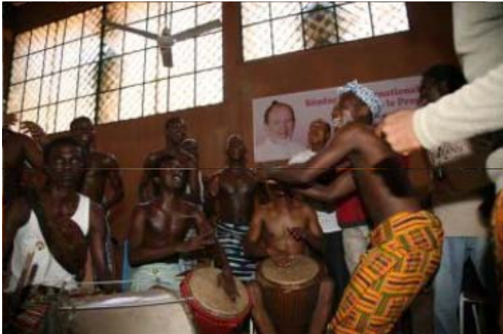
'Club Rouge' Ambiente