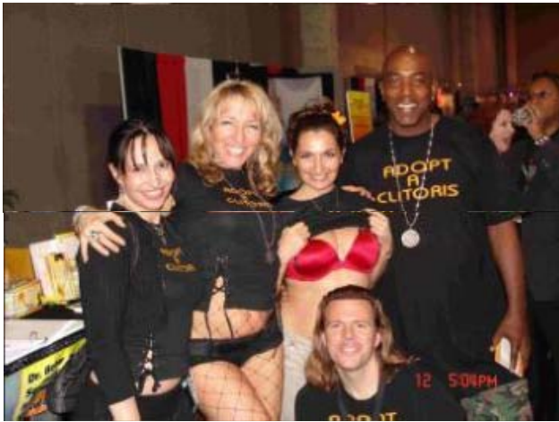
Parte del equipo feliz