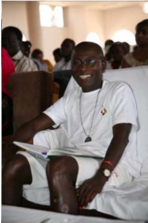
Tai, Guia continental de Kama