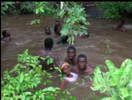
Dans la piscine...