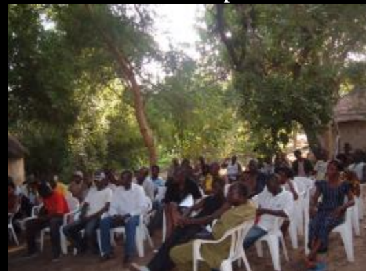
Méditation en extérieur