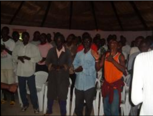
Dans la salle de cours

Soeurs et frères raéliens du monde entier, RENDEZ-VOUS EN DECEMBRE POUR L'ACCUEIL DU NKUA TULENDO.