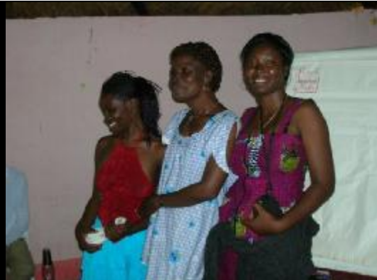
Nos trois sœurs réparées J