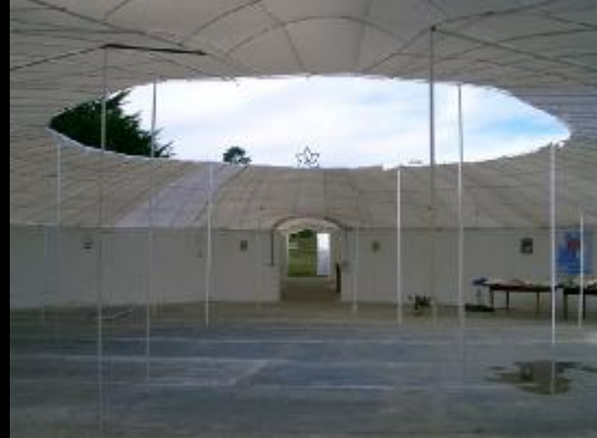
Vous y serez l'an prochain??? J