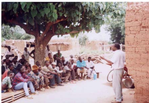
L'entretien avec les nouveaux avant les tpc