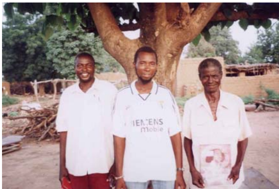
de gauche à droite: le responsable du village, l'assistant et le chef de village.

Difundamos los mensajes en todas partes..... Donde quiera que haya humanos, hay gente abierta y esperando escuchar sobre nuestros Creadores. En Burkina tuvimos 107 transmisiones entre las cuales habian 28 que fueron hechas en la prision de Ouagadougou donde el guia Yael ha estado ensenando Raelianismo durante un ano.